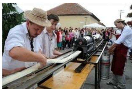
Megdől a rétesrekord Mórahalmon